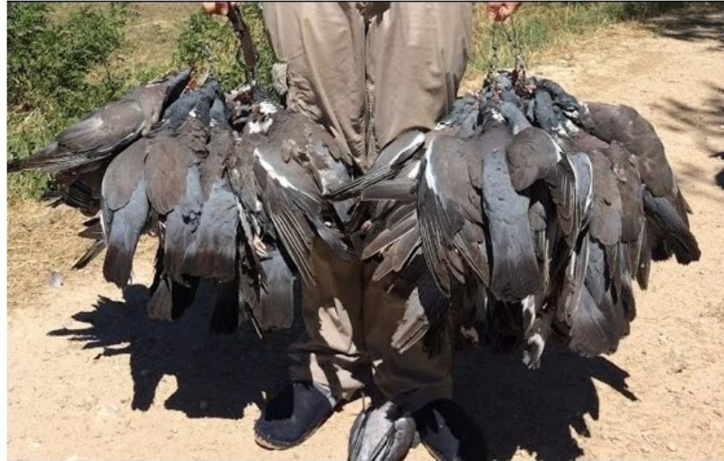
Perchas de palomas torcaces