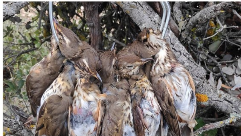
Percha de zorzales